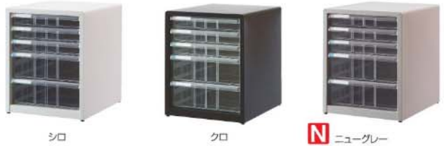
シロ クロ N ニューグレイ