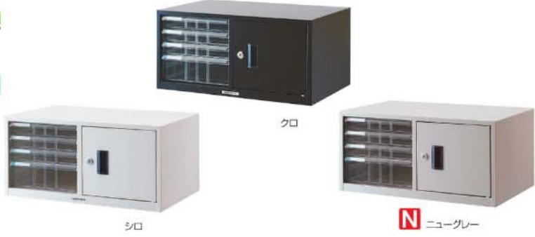
シロ クロ N ニューグレイ