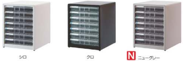
シロ クロ N ニューグレイ